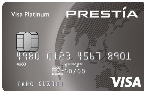
<PRESTIA Visa PLATINUM CARD>